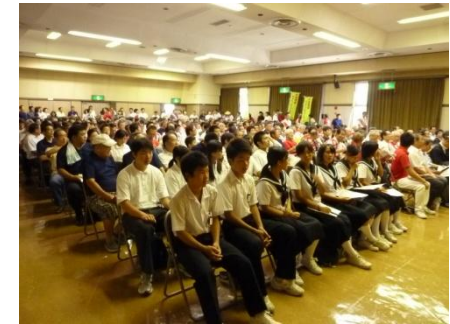
幡豆中学校・西尾高校・吉良高校の生徒達が意見発表をしました。